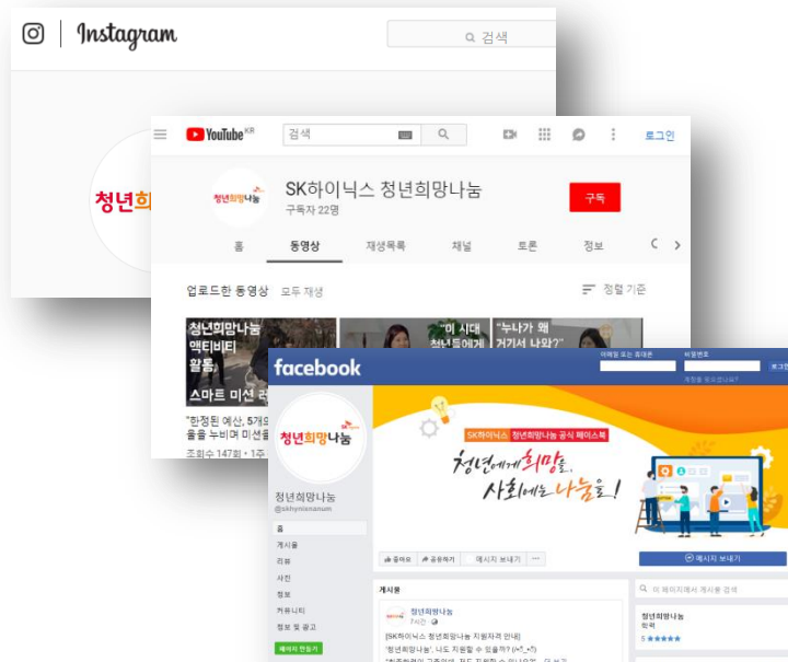
YouTube · Facebook · Instagram

YouTube : https://www.youtube.com/channel/UCT9BQZJ0_DtYmHeQTcdu5ow#